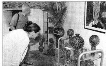
■ A Scarpatetti Arte c'è spazio anche per l'artigianato

Pregevoli e di notevole portata anche le opere esposte, dal gusto in parte artistico in parte artigianale, realizzate con maestria dagli espositori sia lungo Scarpatetti sia in diversi locali di alcuni cortili. In quest'ambito hanno prevalso la professionalità, l'originalità, il gusto, l'estro, la fantasia degli artigiani che hanno dato vita a forme inusuali, aiutati anche dal materiale reperito in parte dal mondo naturale. Ed ecco il legno intarsiato e intagliato, alleato ideale dell'uomo, che si è prestato a forme e giochi armoniosi, molto apprezzati dai passanti che hanno affollato all'inverosimile una delle parti più caratteristiche della Sondrio vecchia. O