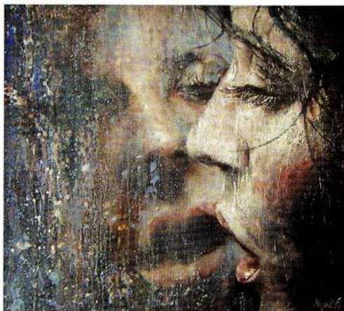
Una giornata di pioggia , olio e tecnica mista su tavola, 80 x 70 cm