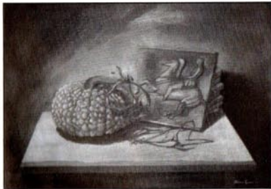
grafico pubblicitario ed un'attenzione alla comunicazione precisa e rigorosa con l'osservatore. E' una pittura morbida, in questo distante dall'ortodossia iperrealista, in cui si intravede una filoso-

Un camice o giacca bianca appesa al cavalletto, un pentolino sul tavolo, un mazzo di fiori orizzontale, una brocca di tolla e una pannocchia legger-