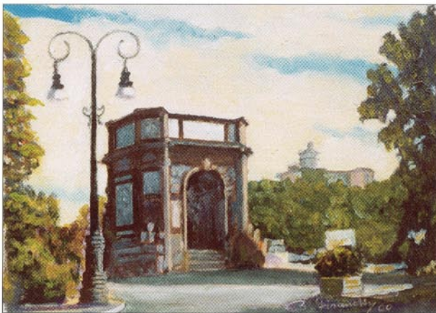
▲ Bruno Fisanotti "Dall'Artigliere ai Cappuccini" olio su cartone telato (20 x 15) anno 2002